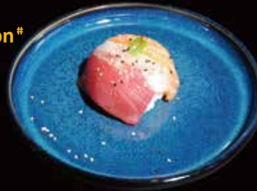
132. Chirashi Mix* Riso guarnito da fette di pesce misto ☺ ① € 6.00