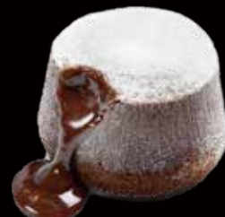
COULANT CIOCC. FONDENTE