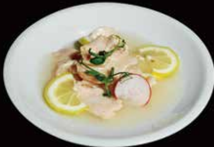
136. Pollo al limone* Pollo, Limone