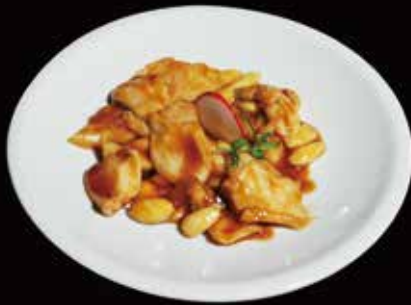
134. Pollo con mandorle* Pollo, Mandorle, Verdure miste