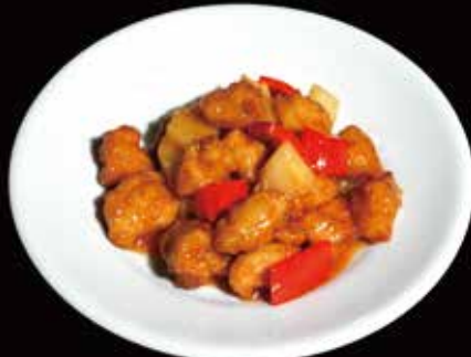
138. Pollo agrodolce* Pollo fritto, Peperoni, Ananas, Salsa agrodolce