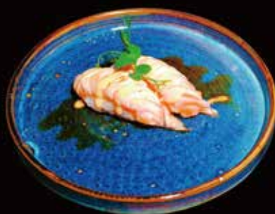
050. Nigiri Aburi # Riso, Salmone alla fiamma ① ② ③ € 4.00