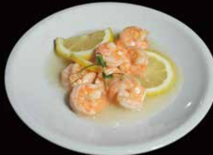
140. Gamberi al limone* Gamberi, Limone