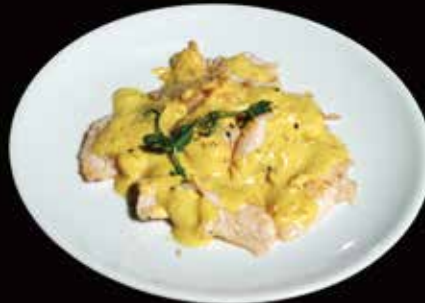
137. Pollo curry* Pollo, Curry, Cipolla