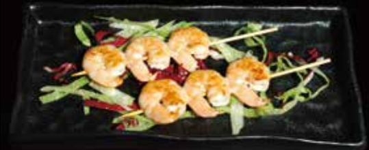
154. Spiedini di gamberi Gambero, Salsa, Pepe ① ② ③ € 6.00