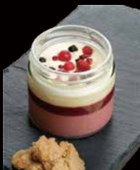
FIOCCO LATTE BOSCO SENZA GLUTINE