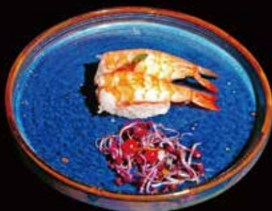
049. Nigiri Ebi # Riso guarnito da gambero ① ② € 3.50