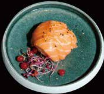
131. Chirashi Salmon* Riso guarnito da fette di salmone ☺ ① € 6.00