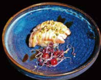
051. Nigiri Aburi Pistacchio Riso, Salmone alla fiamma, Pistacchio ① ② ③ € 4.50