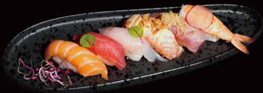
057. Nigiri misto (6pz) # ① ② ③ ④ ⑤ ⑥ € 9.00