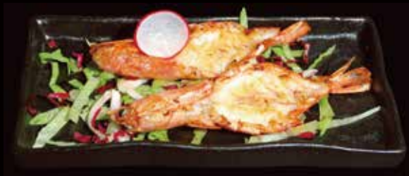
155. Gamberoni alla piastra Gamberoni, Pepe ② € 7.00 ( 3 porzioni )