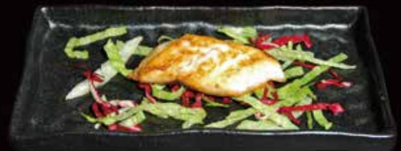
156. Filetto di branzino alla piastra Filetto di Branzino, Pepe ☺ ① € 5.00 ( 2 porzioni )