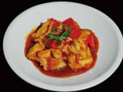
135. Pollo piccante* Pollo, Salsa piccante, Peperoni