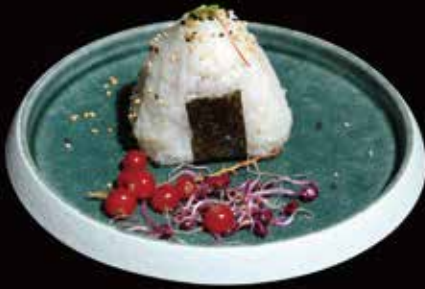
126. Onigiri Salmon* Polpette di Riso ripieni di salmone € 3.50