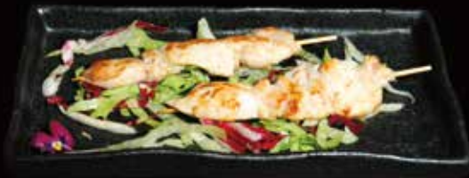
153. Spiedini di pollo Pollo, salsa, Pepe ① € 4.00