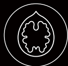
Frutta a guscio