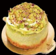
CHEESECAKE PISTACC. CIOCC.BIANCO