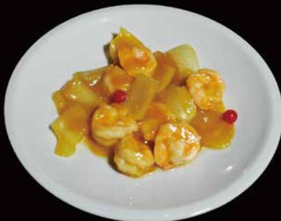
141. Gamberi al curry* Gamberi, Cipolla, Curry