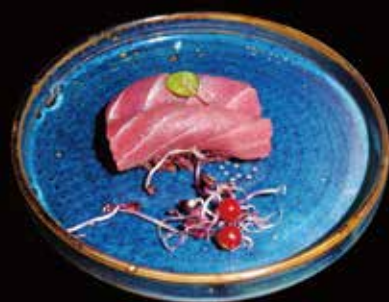
056. Nigiri Black Tuna Riso Venere, Tonno ② € 4.00