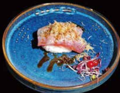
053. Nigiri Kataifi # Riso, Tonno alla fiamma, Kataifi ① ② € 4.50