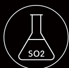
Anidride solforosa e solfiti