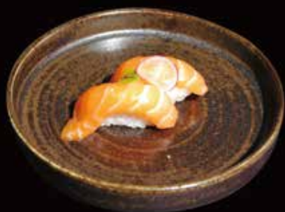
046. Nigiri Salmone Riso guarnito da salmone ① ② € 3.00