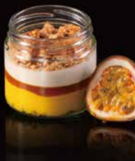
FRUIT PASSION SENZA GLUTINE