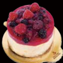
CHEESECAKE FRUTTI BOSCO