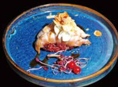
055. Nigiri Black Salmon # Riso Venere, Philadelphia, Mandorle ① ② ③ ④ € 4.50